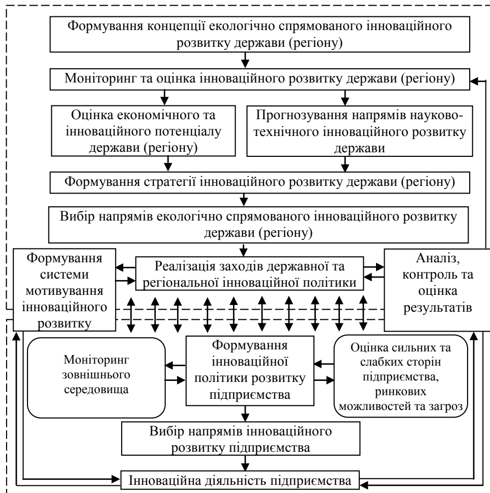
Рисунок 1 – Узгодження рівнів управління екологічно спрямованим інноваційним розвитком

Основні функції управління екологічно спрямованим інноваційним розвитком на різних рівнях показано у табл. 1.