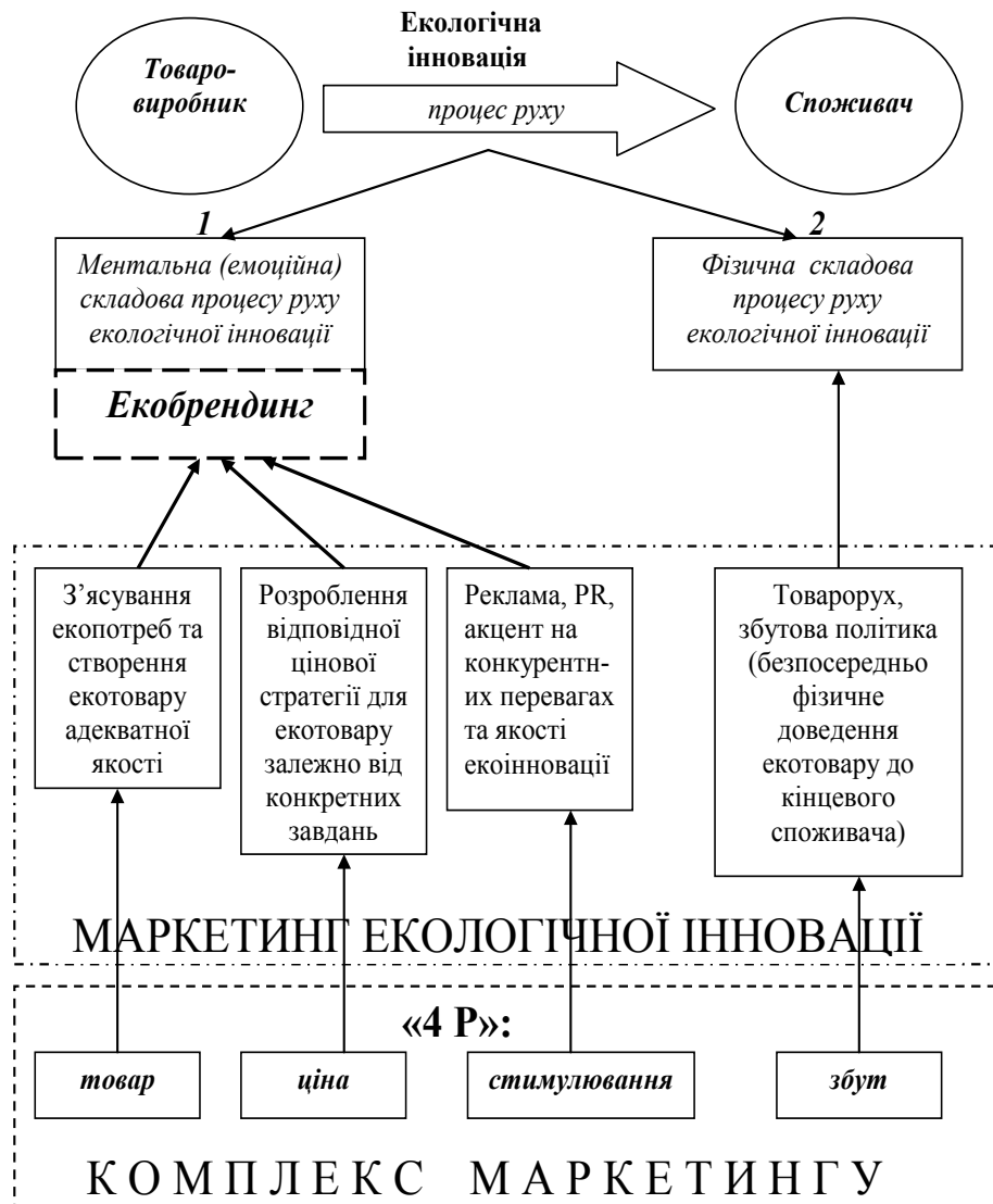
Рисунок 3 – Роль та місце маркетингу інновацій в екобрендингу

Говорячи про роль та місце маркетингу інновацій в екологічному брендингу, прокоментуємо поданий на рис. 3 взаємозв'язок.